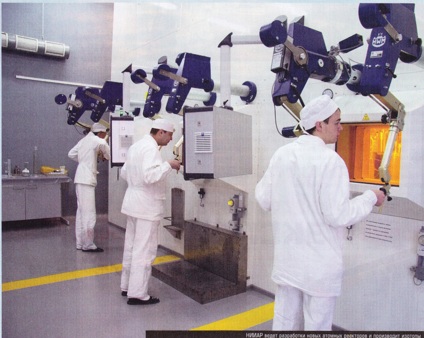
НИИАР ведет разработки новых атомных реакторов и производит изотопы

Ульяновский ядерный кластер служит «технологическим инкубатором» для всех отраслей региона